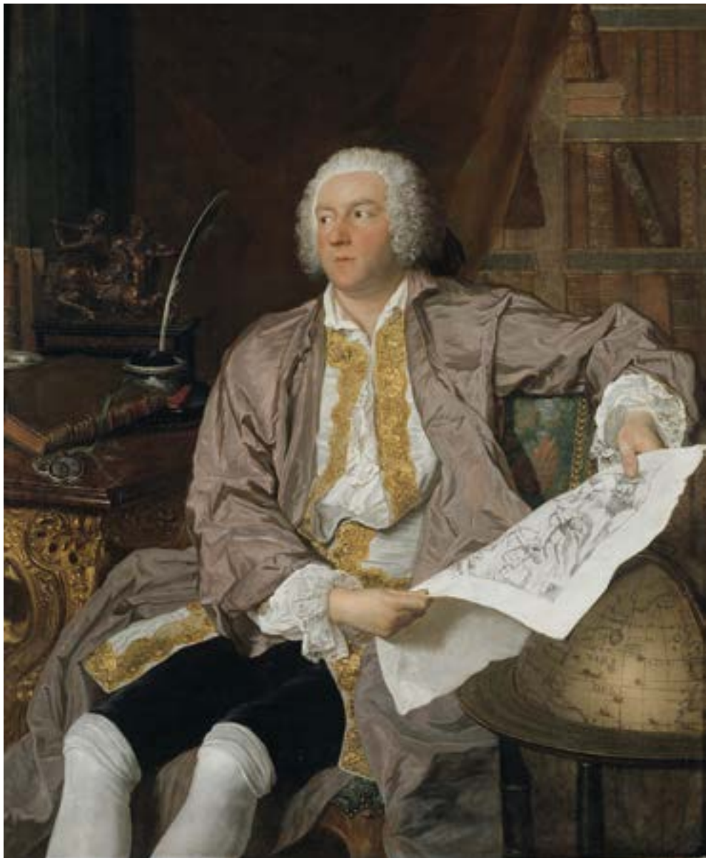
Bild 12. Joseph Aved, Greve Carl Gustaf Tessin (1695–1770) . Hattledaren Tessin var en av Vetenskapsakademiens högst uppsatta mecenater.