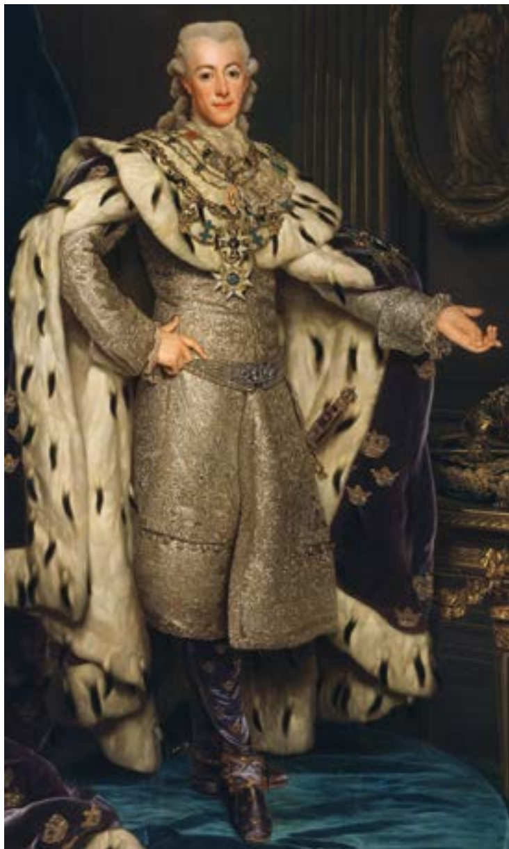
Bild 10. Alexander Roslin, Gustav III, 1746–1792, konung av Sverige .