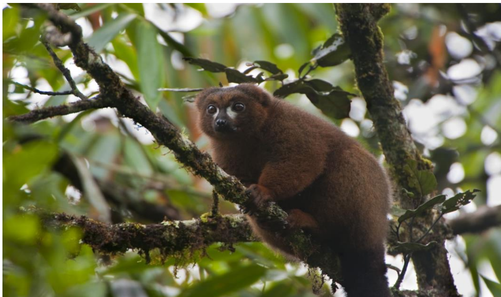
Figure 5. Capture d'image présentant le patrimoine naturel de Madagascar

Image : Le Parc National Ranomafana est situé dans le Sud-est de Madagascar à cheval entre les régions Haute-Matsiatra et Vatovavy Fitovinany. Il se trouve à 412 km au Sud-est d'Antananarivo, à 65 km au Nord-est de Fianarantsoa et à 139 km à l'ouest de la commune de Mananjary. GPS: 47°18' à 47°37' de longitude Est et 21°02' à 22°25' de latitude. Superficie: 41 601 ha ; Région : Vatovavy-Fitovinany