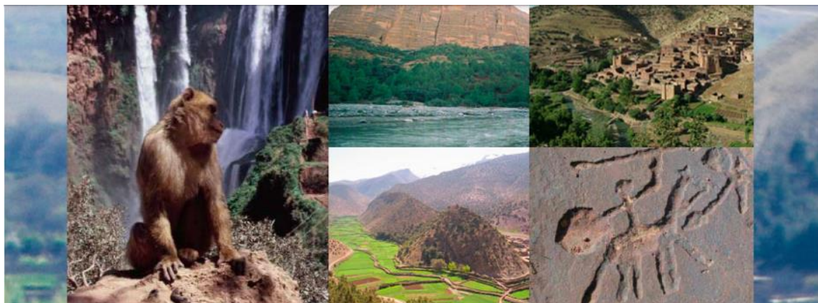
Figure 2: capture d'image présentant le patrimoine du Géoparc M'goun