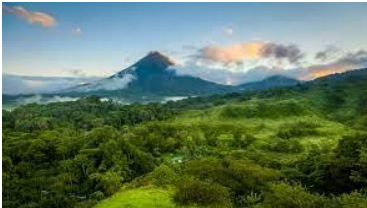
Figure 4: capture d'image présentant le patrimoine naturel du Costa Rica.

Du Costa Rica: Le Costa Rica a de nombreux atouts pour séduire les amateurs de tourisme vert, à commencer par sa faune et sa flore. ... Ce petit pays d'Amérique centrale a également réussi à stopper la déforestation en développant un écotourisme de qualité à la place de la culture des bananes et du café.