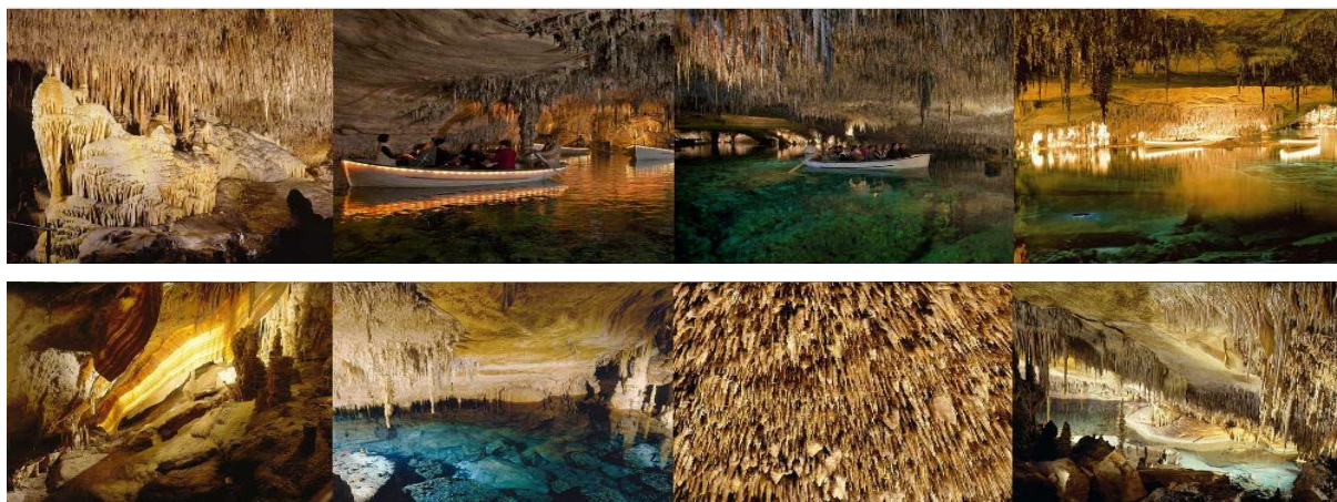
Image présentant: le drapeau, bain de diane, détails de plafond, petit lac

Image présentant: Monte nevado, le concert, promenade en barque, lac martel