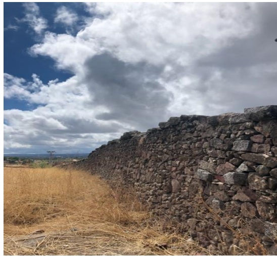
Figura 1. Sendero “Dejando Fuéllega en Villanueva de Córdoba. Muro de Piedra Seca en Villanueva de Córdoba (2022)