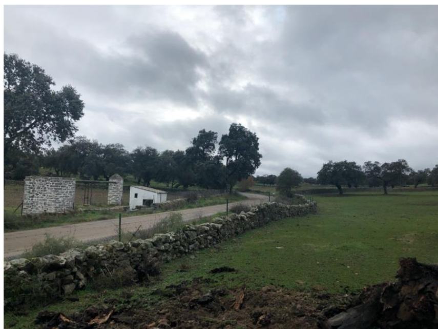
Figura 3. Camino Virgen de Luna, Pozoblanco

Aquellos que se dedicaban al transporte de las piedras se les conoce como “arrieros” y el medio de transporte para dicho material o para realizar desplazamientos eran los jumentos o caballos. El tipo de piedra que se usaba era preferentemente el granito, la pizarra o una combinación de ambas. Asimismo, se debe tener en cuenta y según los habitantes locales, cada municipio tenía una forma de construir, como ejemplo se dice que en la localidad de Conquista la edificación de cercas de piedra se hacía de forma vertical, mientras que en Pozoblanco lo común era el “muro de bolas”. No obstante, a pesar de las variaciones que puedan existir entre municipios había detalles que se presentaban en cualquier muro de piedra como eran los albañales, codales o bardas.